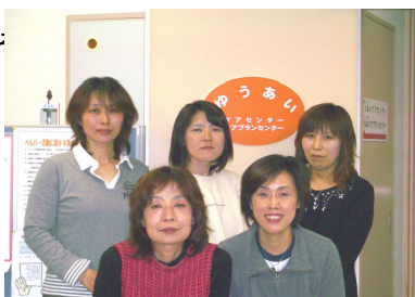
守口支店スタッフ

ライフメイト「ゆうあい」の理念は、『よかった！ ありがとう。あなたがそばにいてくれて…』の具現を目指しご利用者様お一人お一人にあった介護サービスを「まごころ」で提供させていただくことです。 ご利用者の皆様や、サービス提供に携わる社員一人一人の違いを個性として尊重し、各々の違いを条件として受けとめ、お互いに響かしながら「安心してイキイキと暮せる」地域に密着した生活を支援させていただきます。 また、私達は地域貢献活動にも力を注いでいます。みんなで生きる社会を！ ホームページでは、『ライフメイトブログ』や『ゆうあい通信』など私達の思いの発信をさせていただきます。よろしければ、是非ぜひ、ご笑覧ください。