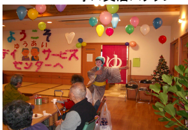
ゆうあいデイサービス