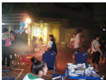
ゆうあい夏祭り風景